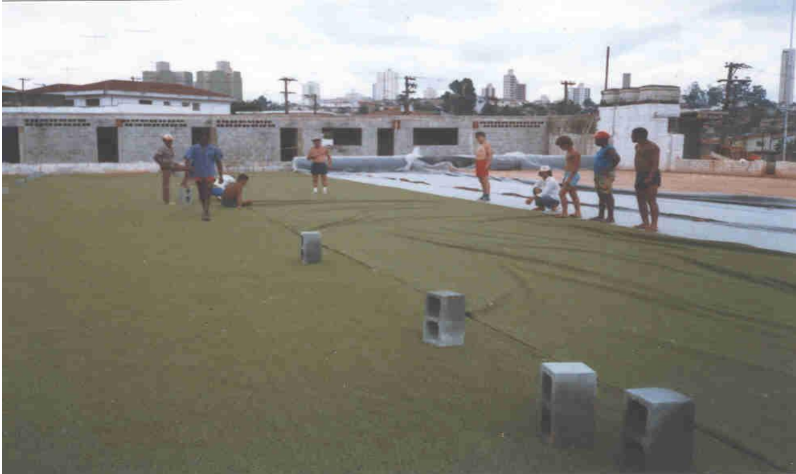
Foto 3 - Ajuste da grama artificial sobre o Geotêxtil Bidim .

Rua do Manifesto, 2082 - Ipiranga 04209-002 - São Paulo - SP Tel.: (11) 2067.0011 Fax: (11) 2060.1211 site: www.ramalho1.com.br e-mail: vendastecnicas@ramalho1.com.br