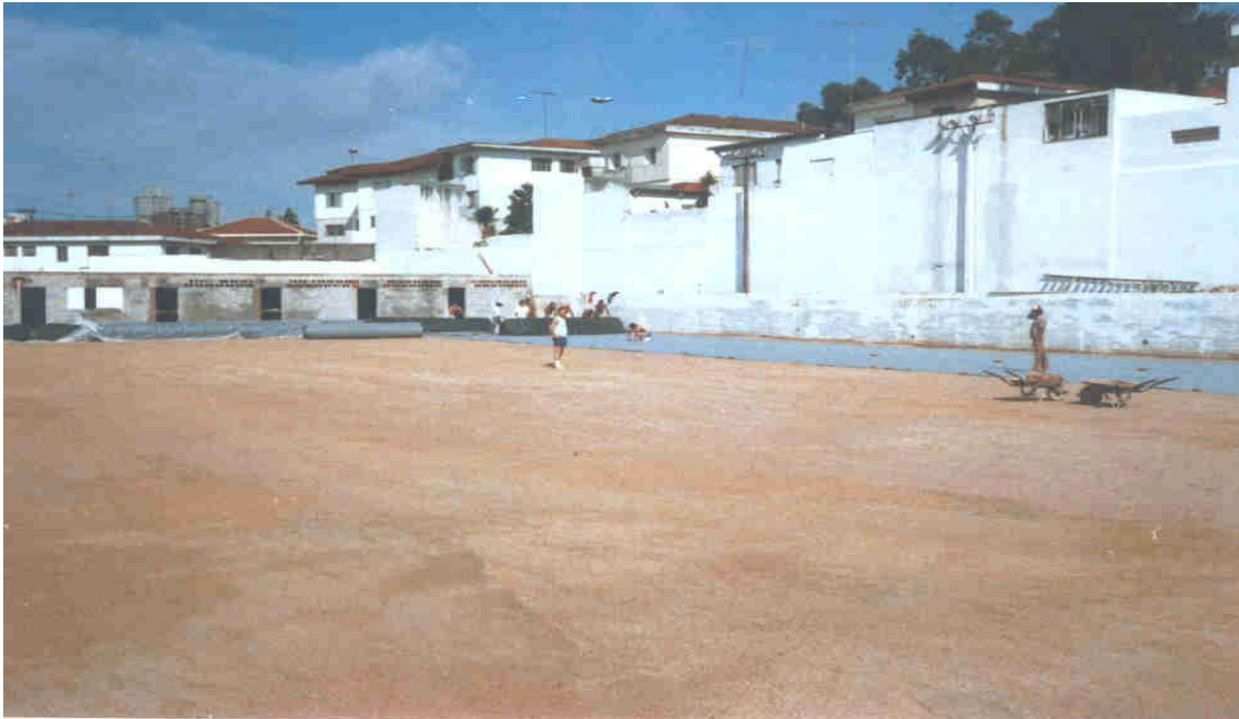
Foto 1 - Colocação de Geotêxtil Bidim sobre o colchão drenante de areia.